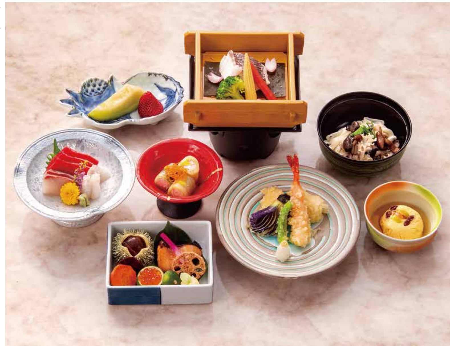
前菜・御造・煮物・蒸し物・揚げ物・酢の物・食事・水菓子 Appetizer, Sashimi, simmered dish, steamed dish, deep-fried dish, vinegared dish, meal, and fruit