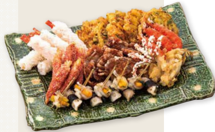
ソフトシェルクラブ・ソフトシェルシュリンプ (殻が固くなる前の希少な蟹・有頭海老)