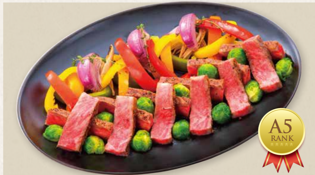
極選黒毛和牛ロースステーキ 17,600円(税込) Superior Japanese Black Beef Loin Steak