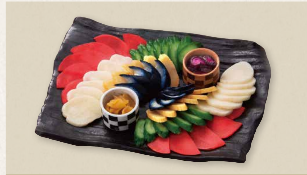
お新香七種盛合せ