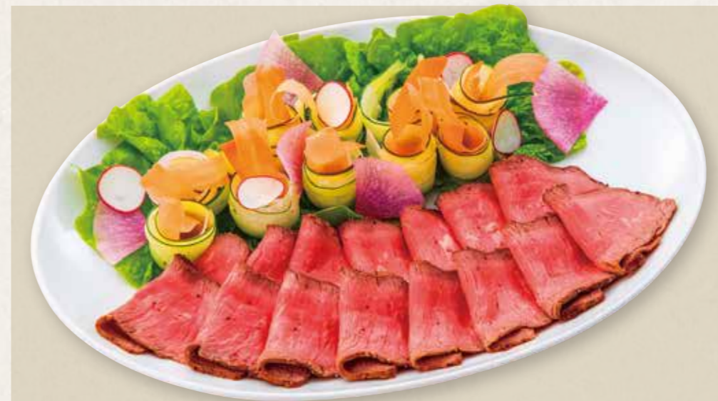
自家製ローストビーフ オリジナルソース使用 13,200円(税込) Homemade roast beef with original sauce