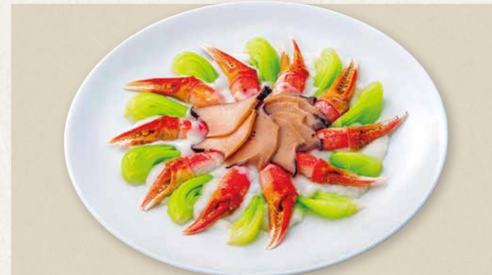
ズワイ蟹爪と鮑のクリームソース 14,300円(税込) Snow crab claws and abalone in cream sauce