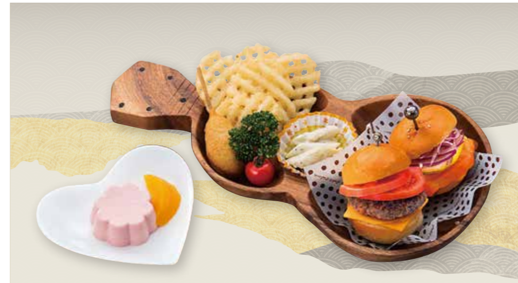
お子様Aセット 洋風