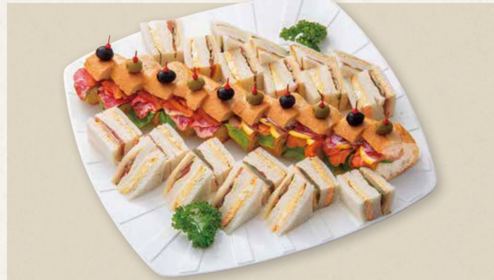
サンドイッチ盛合せ