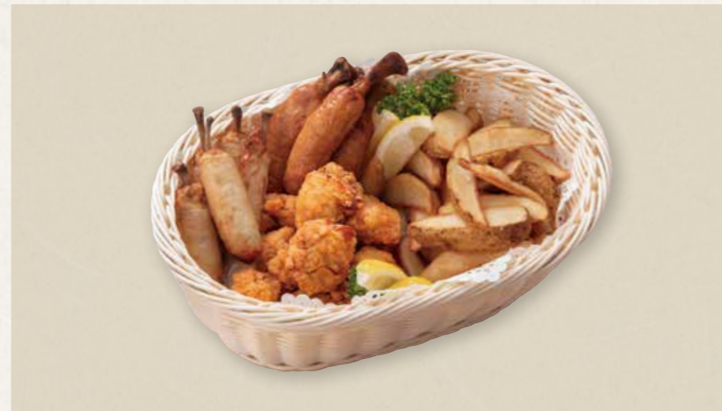
チキンバスケット

Assorted sandwiches バケットサンド(ポークパストラミ・スモークサーモン) ミックスサンド(ハム・チーズ・トマト・キュウリ・タマゴ)