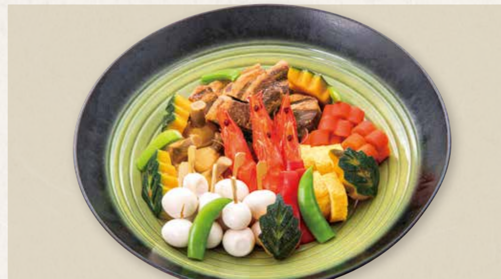
特選炊き合せ 9,900円(税込) Special boiled assortment 豚バラ角煮・有頭むき海老・笹がき信田・木ノ葉南瓜・黄金くわい・スナップエンドウ・梅人参・赤ピーマン・うずら