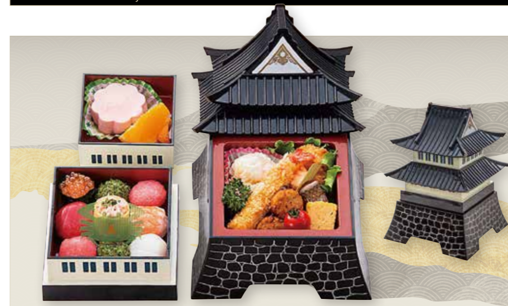
お子様Aセット 和風