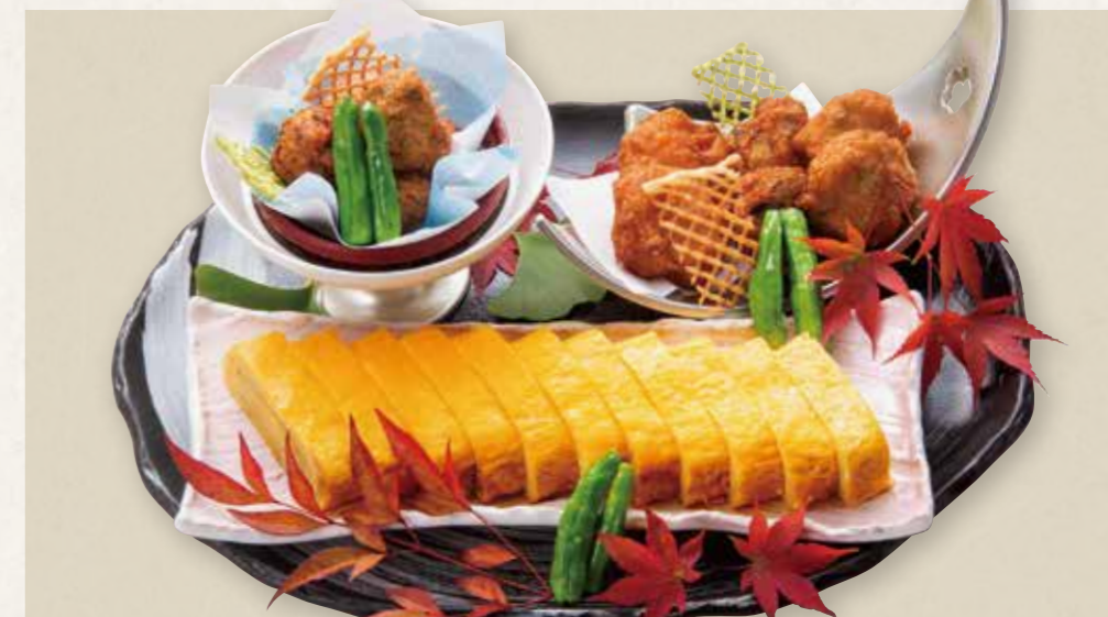
手作り薩摩揚げ盛合せと自家製出汁巻き玉子 8,800円(税込) Handmade Satsuma-age assortment and homemade Dashimaki Tamago 桜海老・しらす・青のり・枝豆・ひじき・人参・万能葱