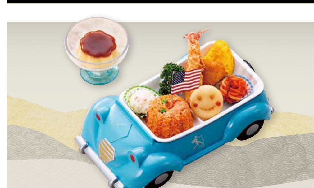
お子様Bセット ブルー