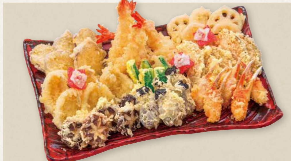
特上天婦羅盛合せ 11,000円(税込) Special Tempura Assortment 海老・蟹爪・鱈・椎茸・さつま芋・蓮根・小茄子・南瓜・ズッキーニ