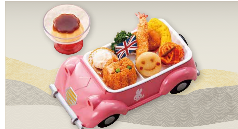
お子様Bセット ピンク